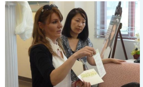
ハワイブライダル研修