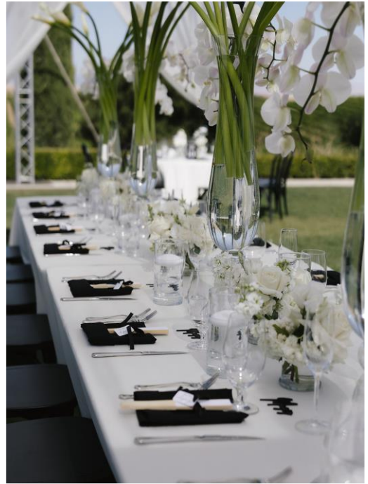
Design by Fairy Godmother Events, Inc.

今後のウェディング装飾のシーズンは、変化、持続可能性、そして個性を大切にすることがテーマです。クライアントが自然をテーマにしたもの、ミニマリストのエレガンス、または大胆で多彩なスタイルのどれを求めているか、これらのトレンドを取り入れることで、流行に沿いながら個性的なウェディングを提供することができます。これらの要素をデザインに組み込むことで、ウェディング後もカップルやゲストに深く響く、忘れられない体験を作り出すことができます。